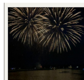
Feuerwerk Poole Harbour